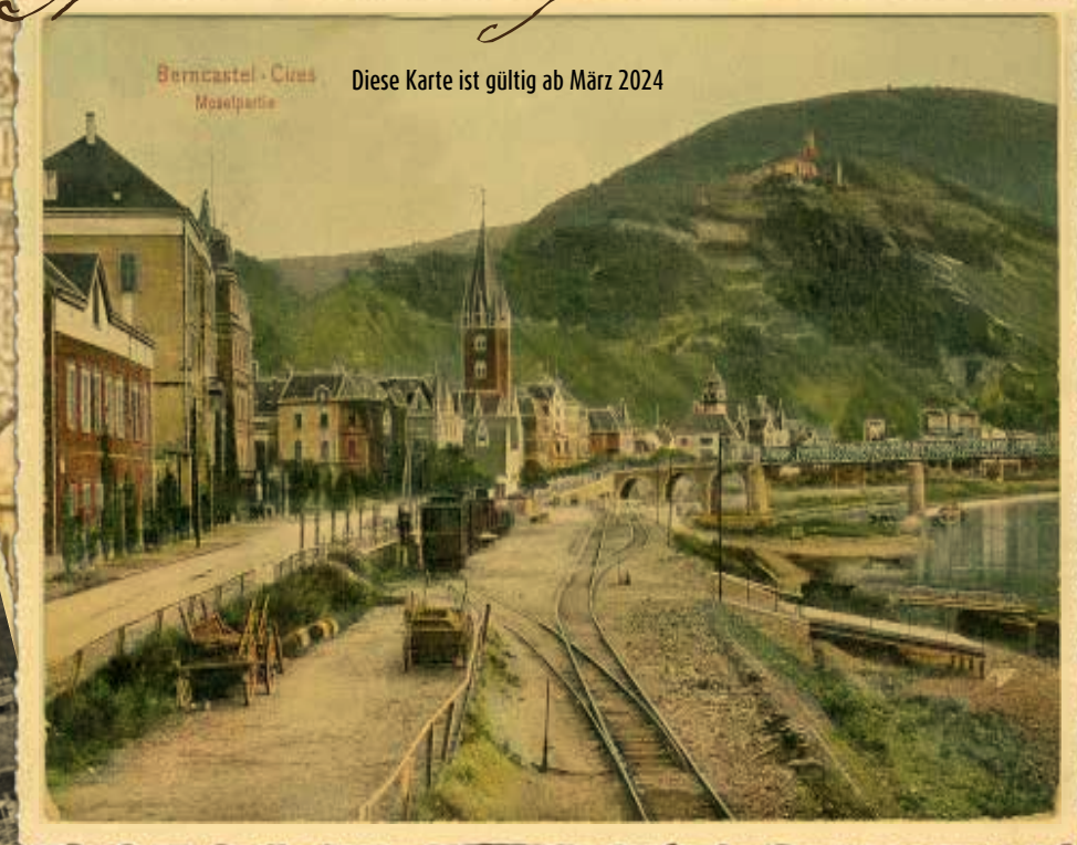
Bernkastel - Kues Moselpark Diese Karte ist gültig ab März 2024